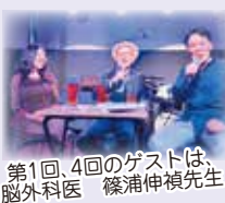
第1回、4回のゲストは、 脳外科医 篠浦伸禎先生

第7回 2024年11月29日(金) 18:00~21:30 (17:40開場)