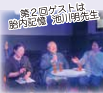
第2回ゲストは 胎内記憶 池川明先生